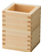
スタッキング檜 ・1合樹(塗装付)

19-163-03(38053) 2,400円 約11.2×11.2×H6.2cm / 内寸約8.8×8.8×H5.2cm